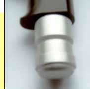
Verschlossener Lufteinlass mit Verschlusskappe (zum Reinigen mit Wasser stets aufsetzen).