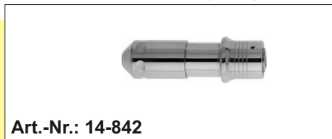
Schnellspannfutter für Kirschner-Drähte Ø 0,8 -3,0 mm