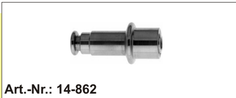
Schnellkupplung für Bohrer mit AO-Ansatz